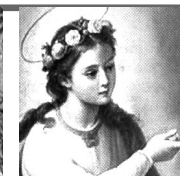
Santa Inés, virgen m.