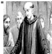
San Mauro Abad

Próxima Jornada de 40 horas de Oración: Lunes 6 y Martes 7 de Febrero, 2023 Súmate a este bello apostolado inter-parroquial: “Una sola Iglesia, un solo corazón”