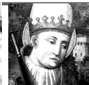
San Marcelo I, Papa