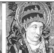
San Fabian, papa