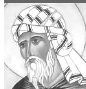
San Juan Damasceno

Próxima Jornada de 40 horas de Oración: Lunes 5 y Martes 6 de Diciembre Súmate a este bello apostolado inter-parroquial: "Una sola Iglesia, un solo corazón"