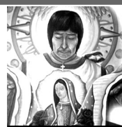
San Juan Diego