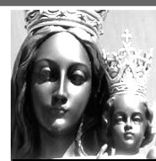
Virgen de Loreto