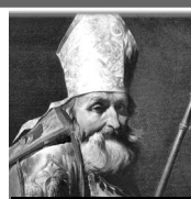
San Ambrosio Obispo