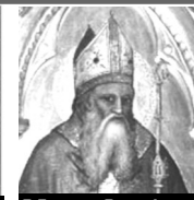
S Ernesto Steisslingen