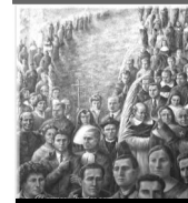
88 Martires de España