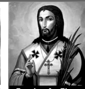
San Josafat Obispo