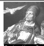
San León Magno, Papa