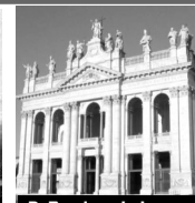
D. Basilica de Letran