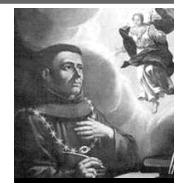
Bto Juan Duns Escoto