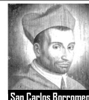
San Carlos Borromeo