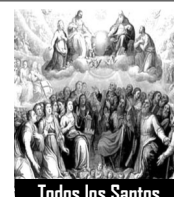
Todos los Santos