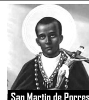
San Martin de Porres