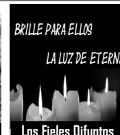
Los Fieles Difuntos