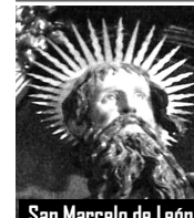
San Marcelo de León

Próxima Jornada de 40 horas de Oración: Lunes 7 y Martes 8 de Noviembre Súmate a este bello apostolado inter-parroquial: “Una sola Iglesia, un solo corazón”