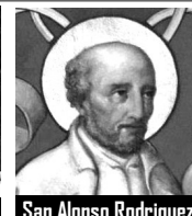
San Alonso Rodríguez