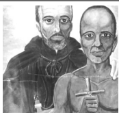
San Moisés, profeta