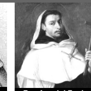
San Angel d Sicilia