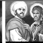
SS Felipe y Santiago