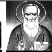
San Atanasio, Obispo