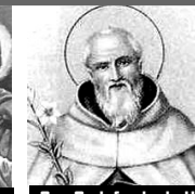
San Godofredo de H.