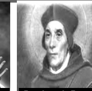
San Juan de Beverly